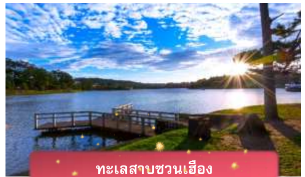
ทะเลสาบชวนเอื้อง

ที่พัก The Western Hill ระดับ 4 ดาวหรือเทียบเท่า