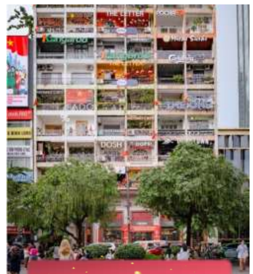
The Cafe Apartment.

ที่พัก Sai Gon Emerald ระดับ 4 ดาวท้องถิ่นหรือเทียบเท่า