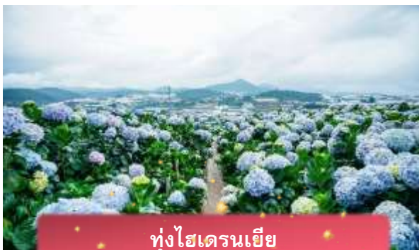
ทุ่งไฮเดรนเยีย

นำท่านเล่น นั่งโรลเลอร์โคสเตอร์ ชมธรรมชาติท่ามกลางป่าสนไปยัง น้ำตกตาดันลา สัมผัสอากาศบริสุทธิ์และบรรยากาศสดชื่น พร้อมจิบเครื่องดื่มชม วิวธรรมชาติ นำท่านเดินทางสู่ ทุ่งไฮเดรนเยีย อีกหนึ่งทุ่งดอกไม้ ที่ไม่ควรพลาดมาถ่ายรูปกัน ข้อดีของที่นี่ คือ ดอกไม้จะบานตลอดทั้งปี