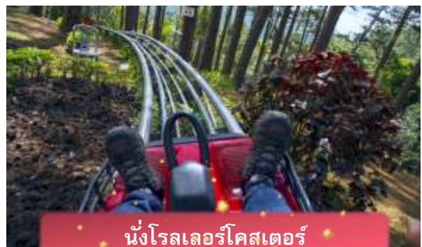
นั่งโรลเลอร์โคสเตอร์