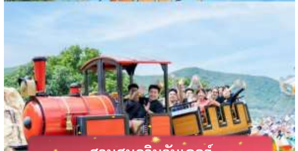
สวนสนุกวินวันเดอร์